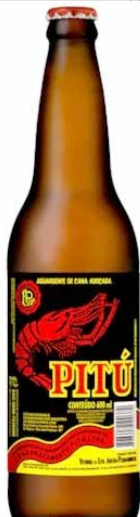
A Pitu é uma das cachaças mais vendidas no exterior