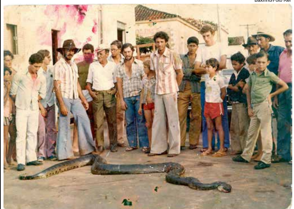
A PET DA PRAÇA SANTA ISABEL, EM CATIGUÁ

A lendária sucuri Ciça, que habitava a praça Santa Isabel, no coração de Catiguá, fora morta por um grupo de adolescentes no verão de 1985. O animal, tratado como uma espécie de pet comunitário, recebia água e comida e circulava livremente pelos seus jardins. Na imagem, moradores indignados diante de seu cadáver, num dia marcado por tristeza e revolta