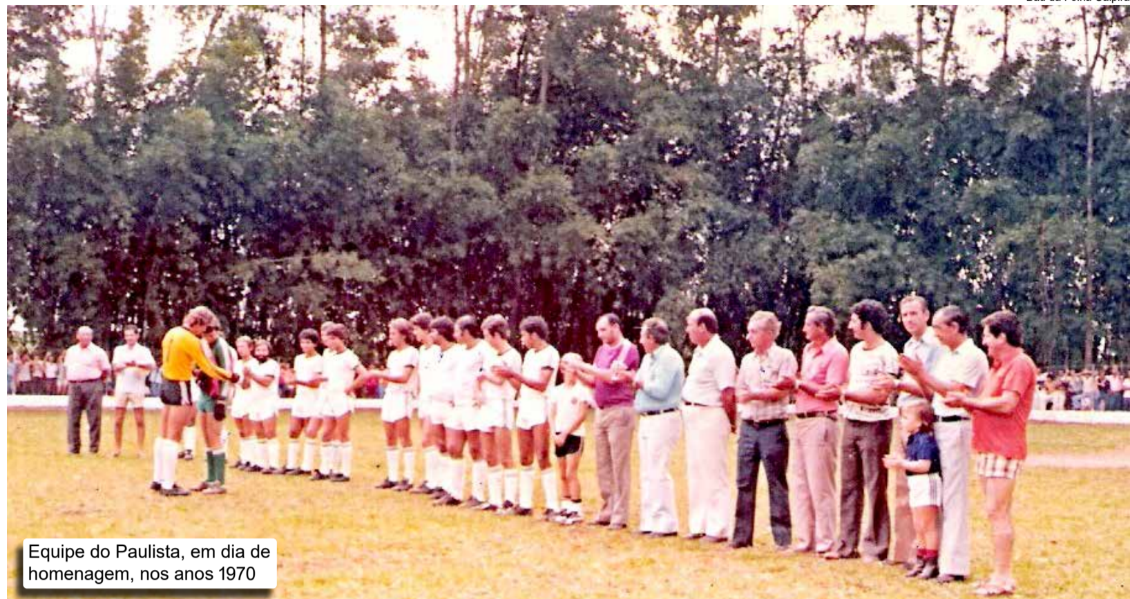
Equipe do Paulista, em dia de homenagem, nos anos 1970