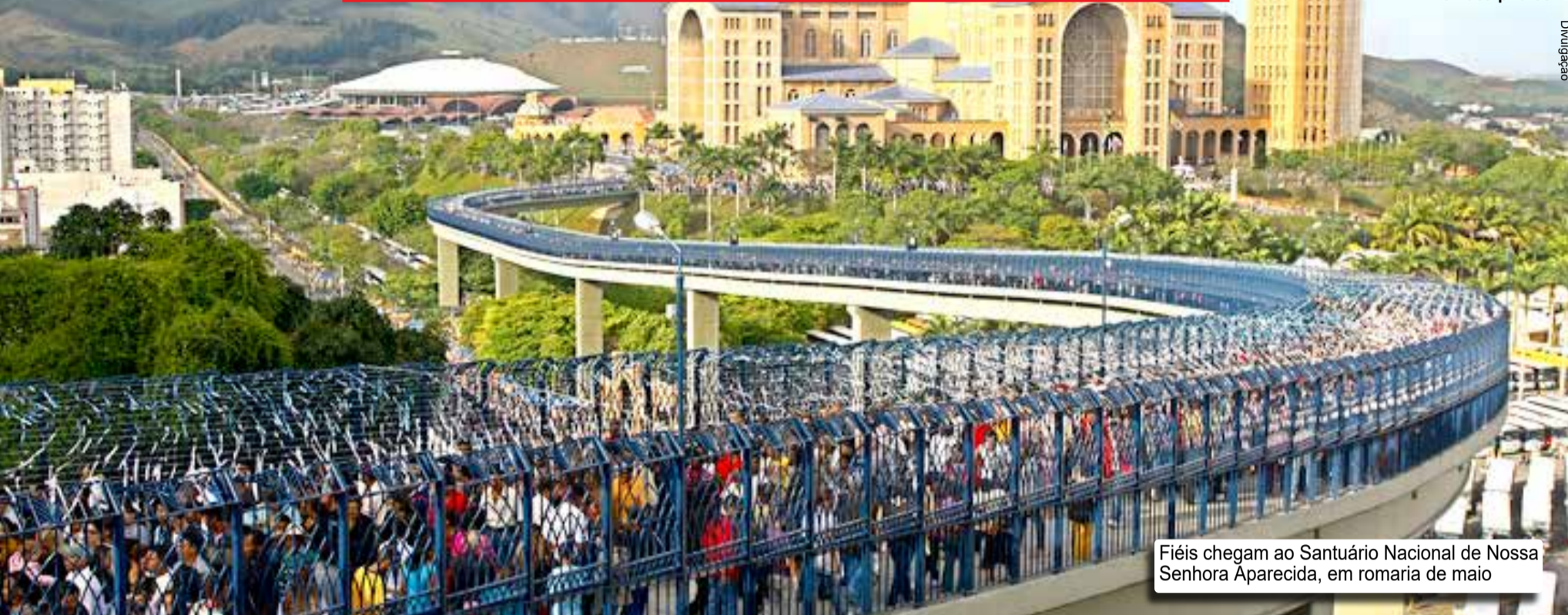
Fiéis chegam ao Santuário Nacional de Nossa Senhora Aparecida, em romaria de maio