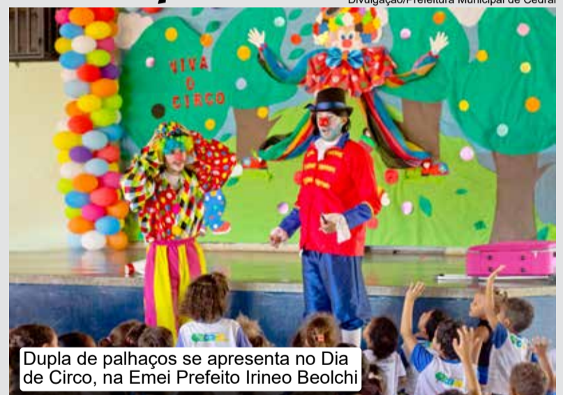
Dupla de palhaços se apresenta no Dia de Circo, na Emei Prefeito Irineo Beolchi

Segundo especialistas, A introdução do circo na escola, seja através de apresentações ou atividades, é fundamental para o desenvolvimento integral dos alunos, pois une educação, arte e lúdico para estimular a criatividade, expressão corporal e socialização. As atividades circenses melhoram o equilíbrio, coordenação, concentração, autoconfiança e a superação de desafios, além de valorizar a cultura popular. (AV)