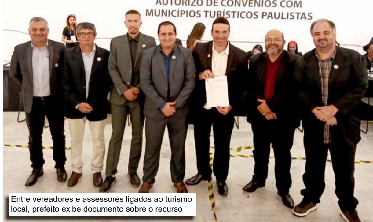
Entre vereadores e assessores ligados ao turismo local, prefeito exhibe documento sobre o recurso

“A Prainha é o principal ponto de referência do turismo de Adolfo, por isso existe um trabalho constante visando estruturar o local para que se torne ainda mais atrativo, tanto para a população local quanto para a grande quantidade