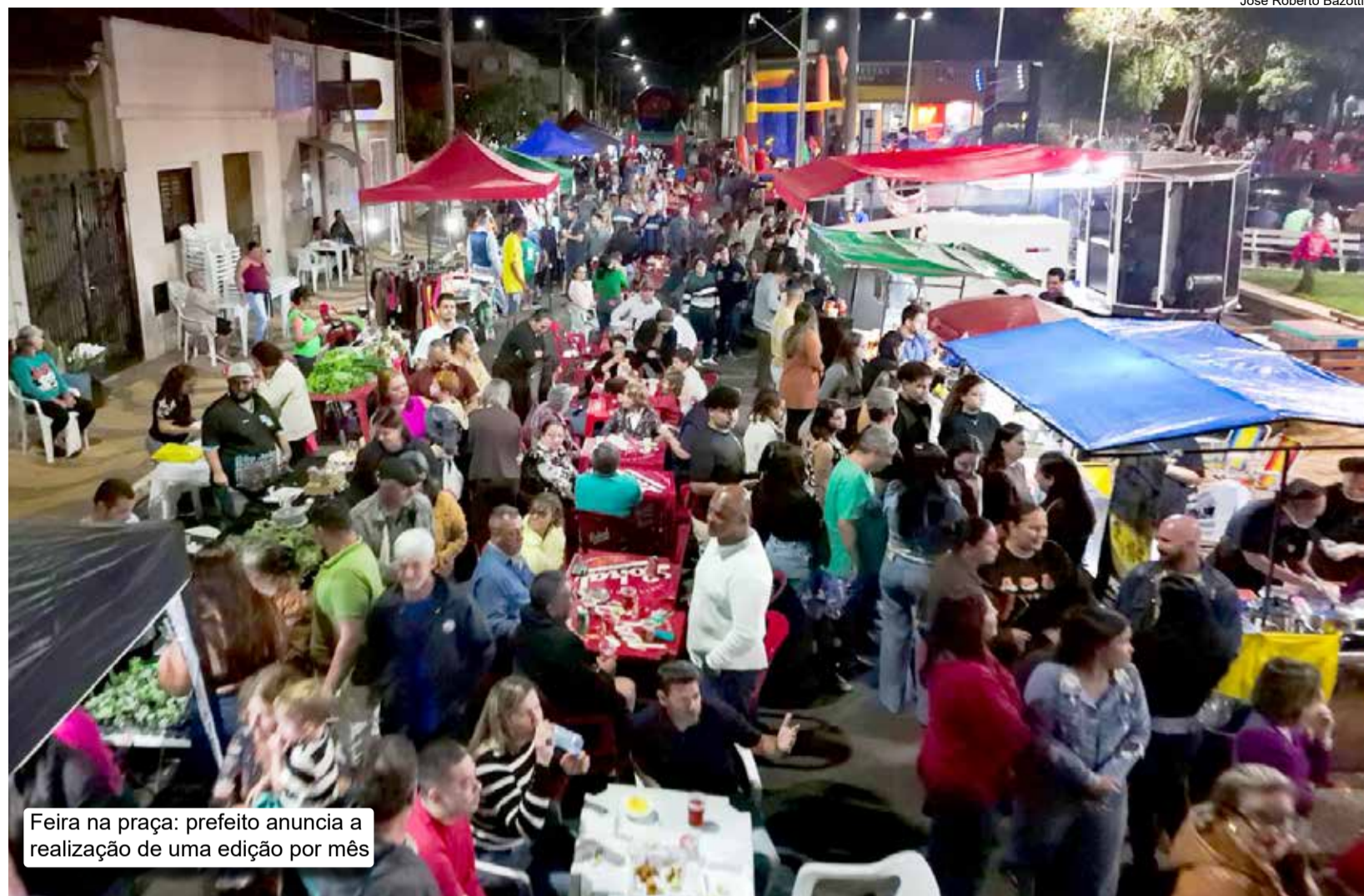
Feira na praça: prefeito anuncia a realização de uma edição por mês