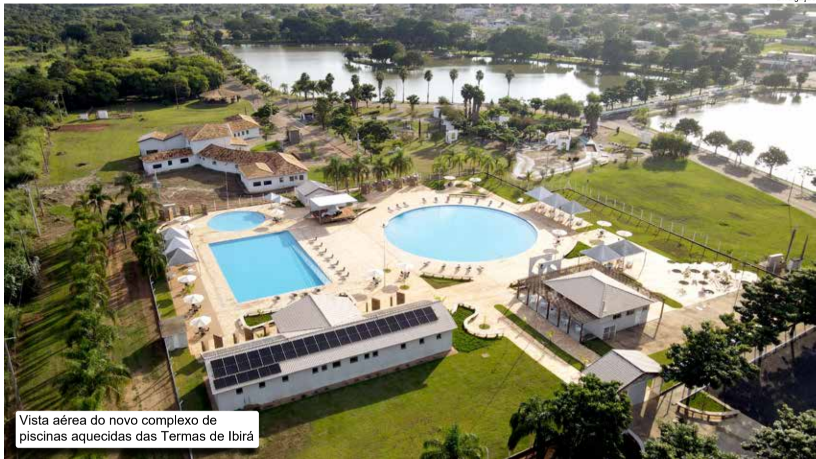
Vista aérea do novo complexo de piscinas aquecidas das Termas de Ibirá