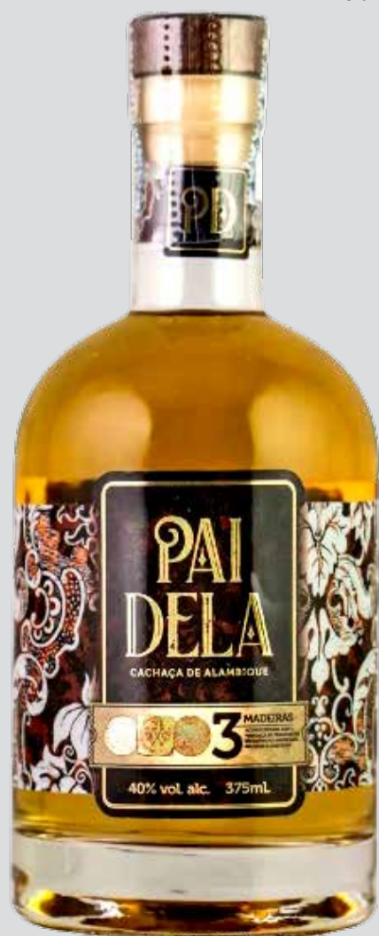
Pai Dela chama a atenção pela qualidade e pelo nome