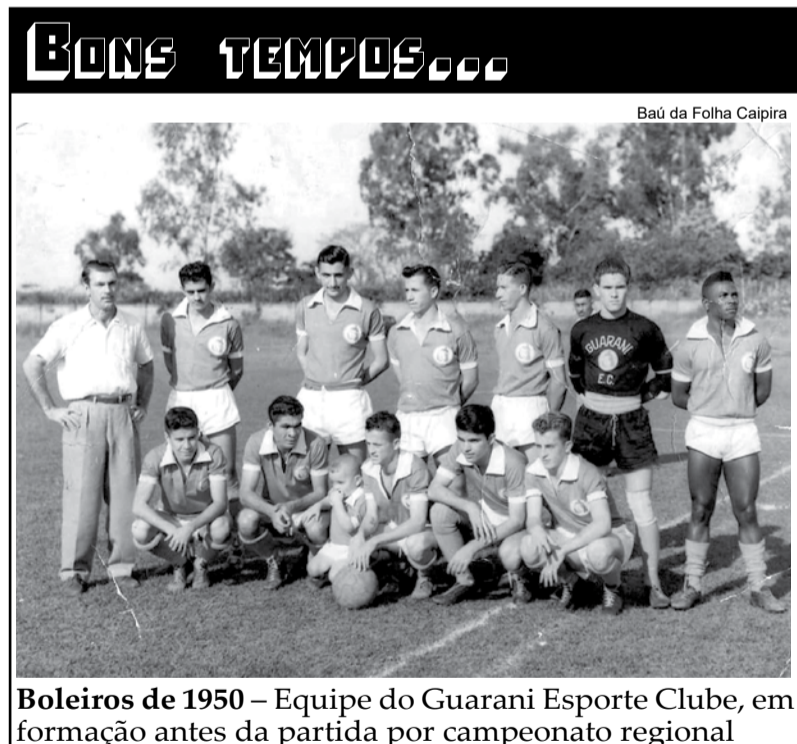
Boleiros de 1950 – Equipe do Guarani Esporte Clube, em formação antes da partida por campeonato regional

O parque funciona diariamente, das 9h às 17h30, com taxa de R$ 5 para entrada de veículos. Já o conjunto de piscinas está aberto aos finais de semana e feriados, no mesmo horário, com valor inicial de R$ 30 por pessoa.