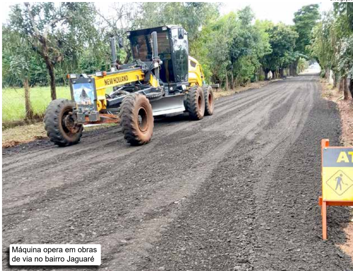
Máquina opera em obras de via no bairro Jaguaré

E o trabalho tem continuidade planejada. Para a próxima etapa, a administração solicitou 1.600 metros cúbicos de fresa para a Estância Trevo, aproximadamente 3.600 toneladas. Também foram encomendados 1.037 metros cúbicos para a Estância Alves, o que equivale a cerca de 1.500 toneladas de fresa asfáltica.