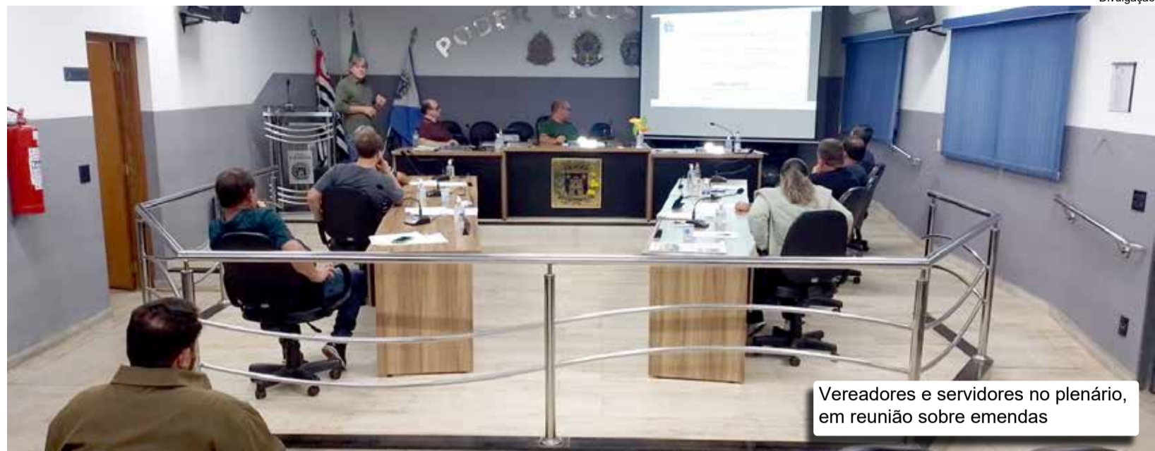
Vereadores e servidores no plenário, em reunião sobre emendas