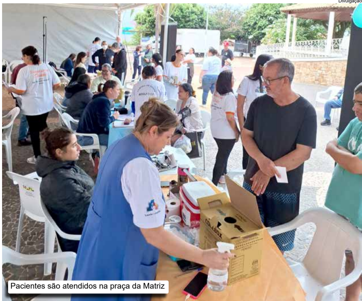
Pacientes são atendidos na praça da Matriz